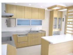
【キッチン・共有スペース】