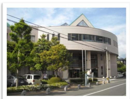
【春日市いきいきプラザ外観】