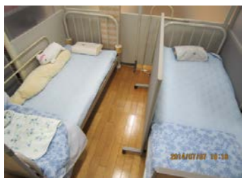
保健・休憩コーナー