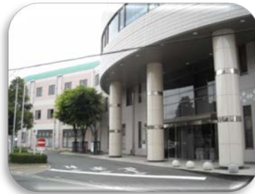
春日市いきいきプラザ