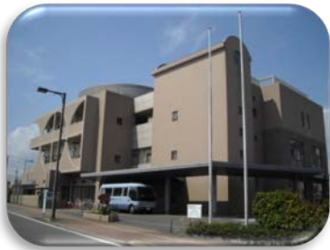
春日市福祉ぱれっと館

そして、今までの実績を評価していただき、平成 25 年 4 月からは、新たに「春日市いきいきプラザ」の清掃業務委託を春日市から請け負っています。