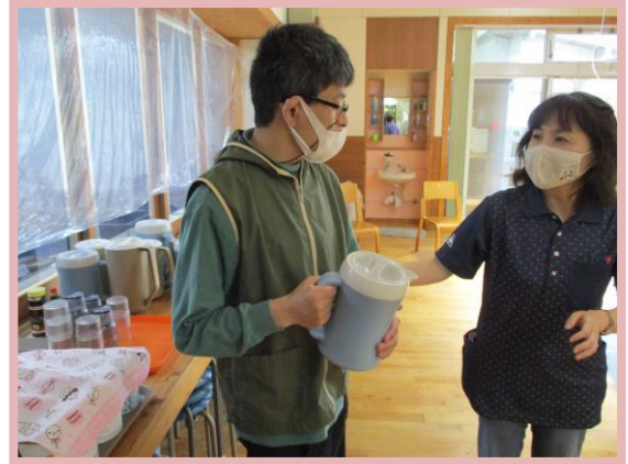
*役割活動（生活介護）