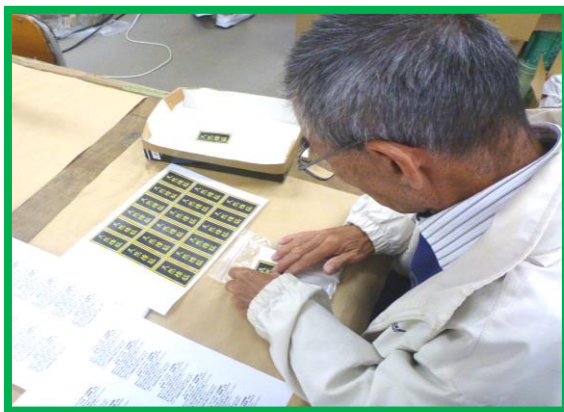
* 下請け作業（商品のシール貼り）