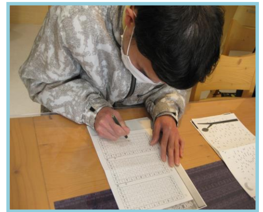
*学習活動（生活介護）