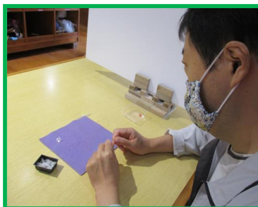
* ビーズ作業（アクセサリ作り等）

○就労継続支援B型事業では、就労能力向上を図るため、挨拶練習や学習会、地域清掃散歩などの活動も行っています。