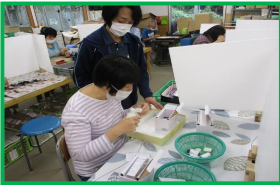
* 下請け作業（検品作業）

生産（作業訓練、作業目標、作業工程など）、販売、工賃支給を通して社会参加を図るとともに、作業の楽しさや完成の喜びを得るよう支援をします。作業科目は、下請け作業（製品の検品、ミラーマット消毒、自動車電子部品の組み立てなど）やビーズ・木工・手芸などです。