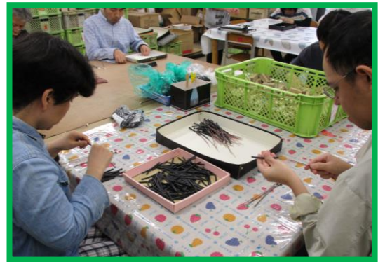
* 下請け作業（自動車電子部品組み立て）