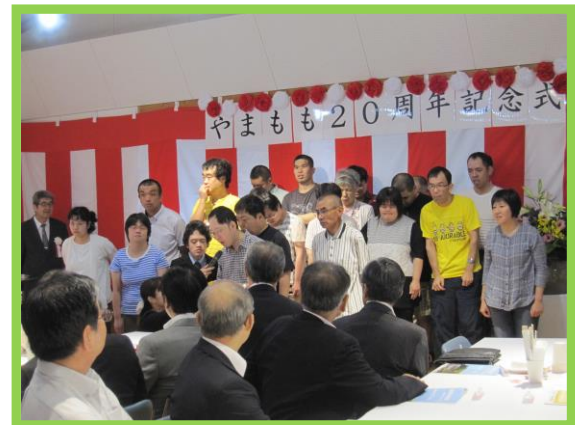
やまもも20周年記念