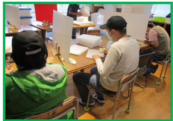
* 下請け作業（ミラーマットの消毒）