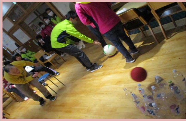
*わくわくサークル（お楽しみ会）