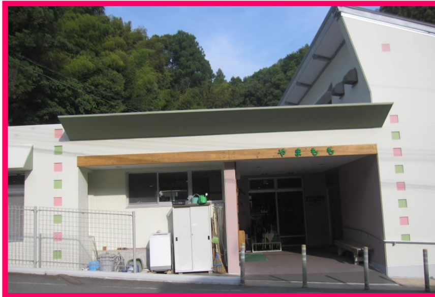
やまもも(正面玄関より)