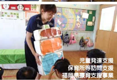
児童発達支援 保育所等訪問支援 福岡県療育支援事業