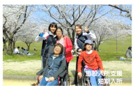
施設入所支援 短期入所