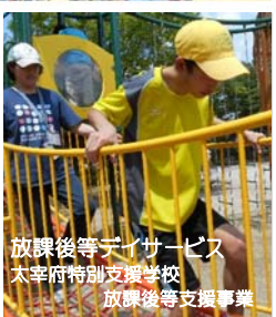
放課後等デイサービス 太宰府特別支援学校 放課後等支援事業