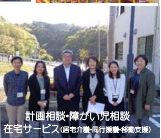
計画相談・障がい児相談 在宅サービス(母介・同行支援・移動支援)